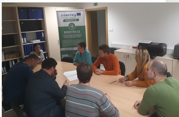
Drugie spotkanie grupy docelowej projektu BOOSTEE-CE w Velenje

Miasto Velenje i E-Institute zorganizowały dwa spotkania grupy docelowej BOOSTEE-CE w Velenje w dniach 10 i 29 października 2018 r. Wydarzenie zostało podzielone na dwie części (spotkanie z przedstawicielami lokalnego biznesu, organizacji doradczej i regionalnej agencji energetycznej). Uczestnicy zostali poinformowani o postępach BOOSTEE-CE i akcji pilotażowej - instalacji inteligentnych liczników w Szkole muzycznej Fran Korun Koželjski Velenje w Gminie Velenje. Przedmiotem dyskusji pierwszego z zorganizowanych spotkań było omówienie pośrednich rezultatów akcji pilotażowej, natomiast drugiego, roboczej wersji platformy OnePlace