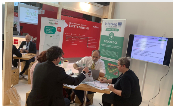
Czwarte spotkanie grupy docelowej projektu BOOSTEE-CE w Rimini

W czasie spotkania przybliżono projekt BOOSTEE ze szczególnym uwzględnieniem platformy energetycznej OnePlace , która umożliwia użytkownikom wymianę doświadczeń, identyfikację dobrych praktyk oraz wyciągnięcie wniosków w tematyce efektywności energetycznej. Uczestnicy spotkania mieli okazję rozmowy z przedstawicielami regionu Emilia - Romagna oraz wymiany pomysłów, sugestii, które zostaną przekazane wszystkim partnerom projektu.